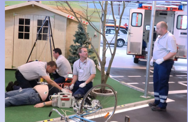
Rettungsdienstschule - RettungsArena